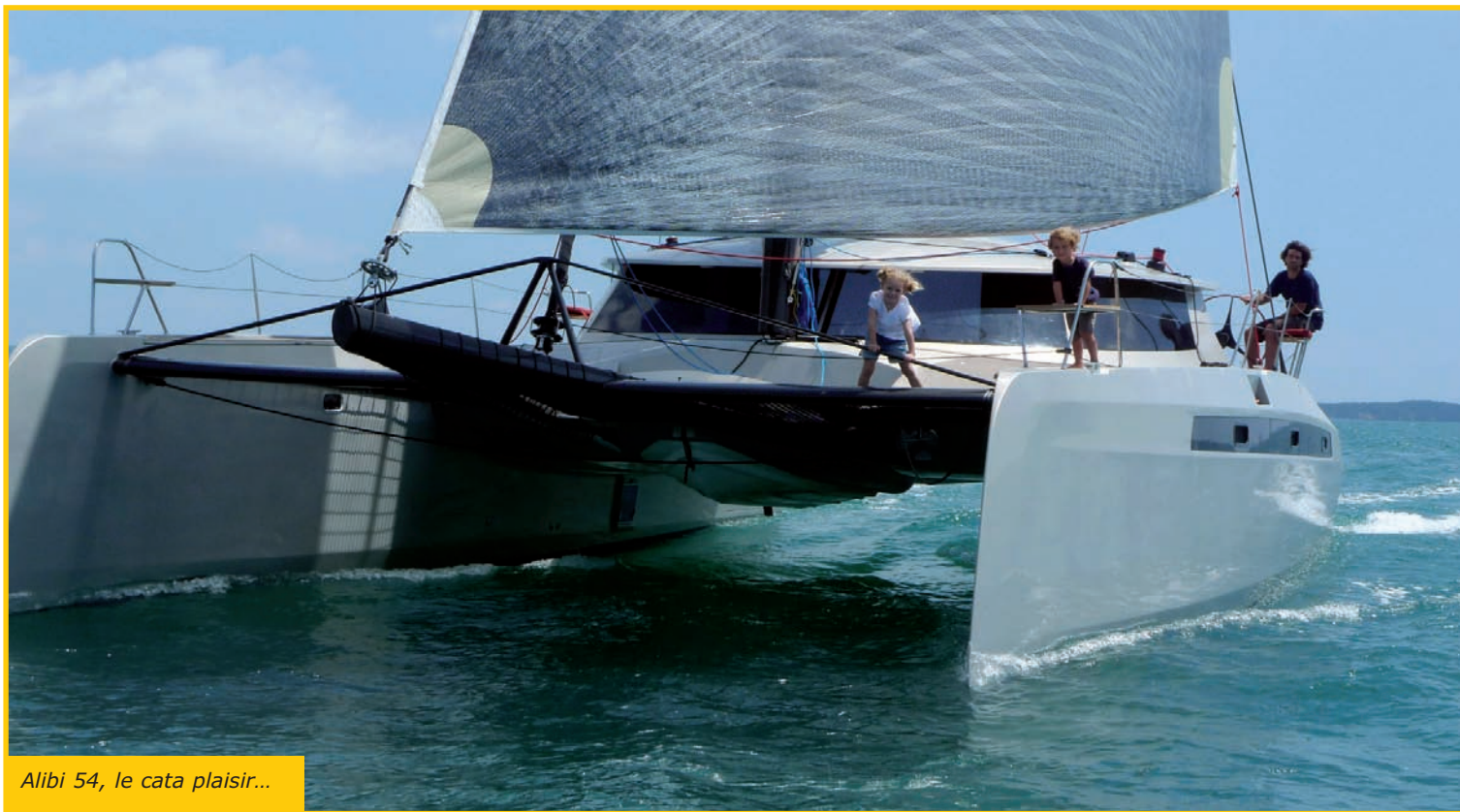
Alibi 54, le cata plaisir...

Fin 2007, Alibi promettait la lune : un cata rapide, capable de belles moyennes à la voile même par très petit temps, et offrant un confort incomparable. Alibi 54 est maintenant à l'eau, l'occasion de découvrir ce bateau novateur !