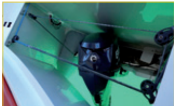
L'annexe s'encastre littéralement sous la nacelle. Finis les 500 kg qui se baladent à l'arrière sur des bossoirs...

vrai confort en navigation... Le propriétaire de l'Alibi 54 a voulu un design moderne, pour un intérieur confortable et tout à fait dans l'air du temps. Mais le chantier insiste vraiment sur