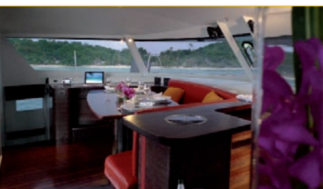
L'intérieur est entièrement custom. Le propriétaire du n°1 l'a voulu moderne mais chaleureux !